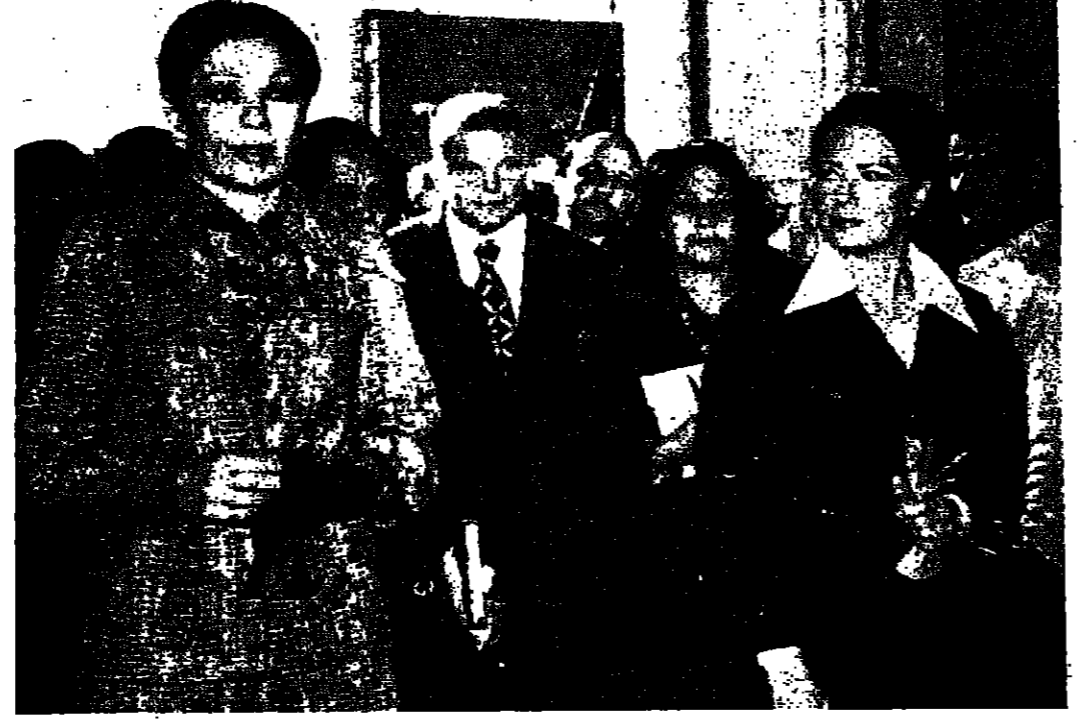
السيدة جيهان السادات والاميرة فخر لدى زيارتهما المتحف الوطني بالقاهرة أمس الأول، ويبدو السيد يوسف السباعي وزير الثقافة

نادي عصام. ٢٠٥٧٨٧. مضمون مطبوع. ١٠٠٪. ٢٠٥٧٨٧. ٢٠٥٧٨٧. ٢٠٥٧٨٧.